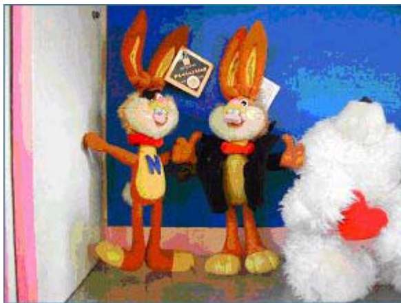
Photo 2: Spielzeug-Hasen produziert von der "Mickey Toys GMBH & Co" im Auftrag von Nestle. Das Foto wurde gemacht nachdem Jennifer ihre Aussage abgab.

Die meisten Erzeugnisse des Arbeitslagers waren für den Export bestimmt. Zum Beispiel hatten die Pullover, die wir anfertigten, Übergröße (XL) für Westliche. Im Februar jenes Jahres kam eine Bestellung über 100.000 Spielzeughasen. Die Polizei des Arbeitslagers sagte, es seien Werbispielzeuge für Nestle, die wohlbekannte Kaffeefirma. Die Hasen waren ungefähr 30 cm groß und hatten einen braunfarbenen Körper mit einem langen Hals. Sie trugen rote Schals um den Hals und hatten 5 cm lange Schnurrhaare an jeder Seite des Mundes. Ich musste die Schnurrhaare machen. Die Hasen hatten unterschiedliche Kleidung an – Cowboywesten, Regenmäntel und einige hatten Augenklappen, um sie wie Piraten aussehen zu lassen. Sie hatten englische Buchstaben auf der Brust. Eine Hand bildete eine Faust mit nach oben zeigendem Daumen und die Füße hatten drei hellgelbfarbene Zehen. Ihre Schwänze waren weiß und kurz.“