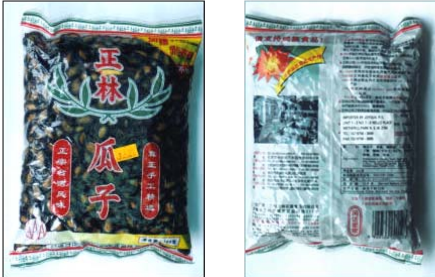
Photo 3: „Zhenglins Melonenkerne, Handverlesen“, Paket; Vorder- und Rückseite

Das Photo zeigt ein Paket von Hand geschälter Zhenglin Melonenkerne, die in Sydney in einem chinesischen Lebensmittelgeschäft verkauft werden. Auf der Vorderseite der Verpackung ist der Preis von $4.80 australischen Dollar zu sehen. Die Rückseite enthält detaillierte Informationen eines australischen Importeurs.