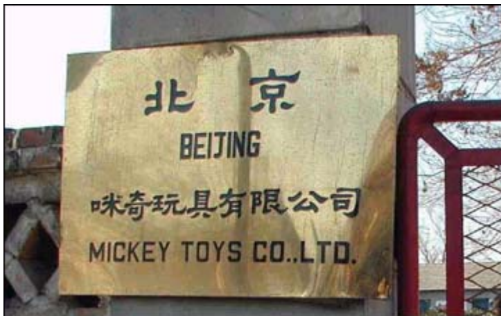
Photo 1: Eingangsschild der Pekinger Firma "Mickey Toys GMBH & Co" am Haupttor der Anlage

Die Produkte werden in viele Länder, darunter die USA, Kanada, Australien, Dänemark, Brasilien, Ungarn, Japan usw. exportiert. Die Firma hat auch einen gewissen Marktanteil in Südostasien. [9]